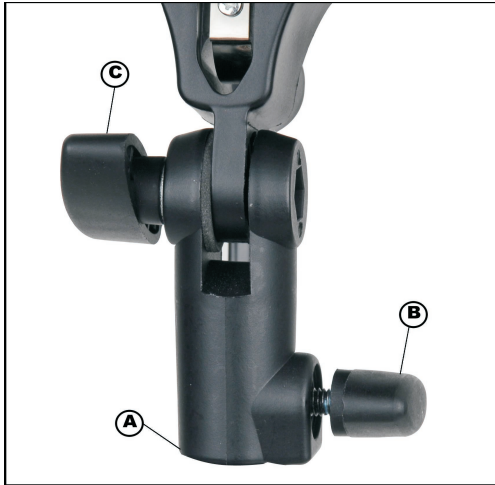
A Stativhalterung B Feststellschraube C Neigungseinstellung

Montieren Sie das Gerät nur auf einem Stativ, das für Gewicht und Abmessungen des Geräts ausgelegt ist. Stellen Sie sicher, dass das Stativ mit dem montierten Gerät kippstabil und rutschfest steht.